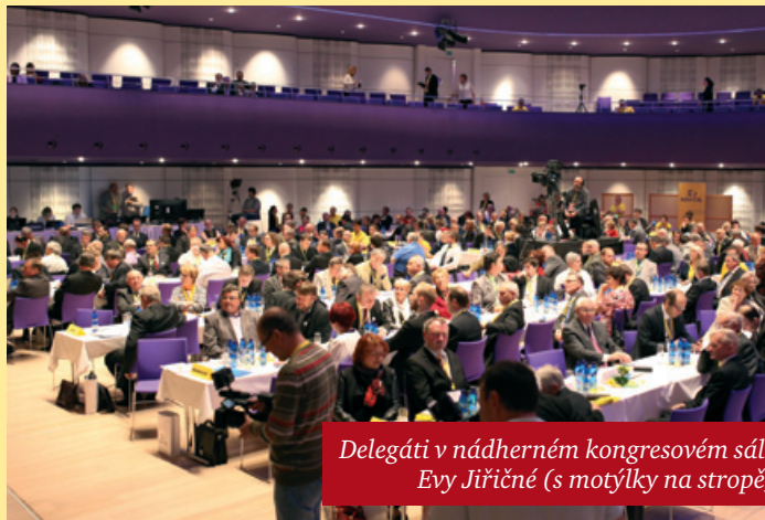
Delegáti v nádherném kongresovém sále Evy Jiřičné (s motýlky na stropě)