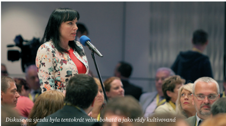
Diskuse na sjezdu byla tentokrát velmi bohatá a jako vždy kultivovaná