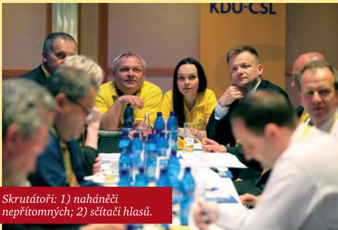
Skrutátoři: 1) naháněči nepřítomných; 2) sčítači hlasů.