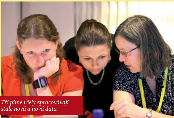
Tři pilné včely zpracovávají stále nová a nová data