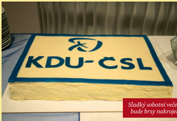
Sladký sobotní večer bude brzy nakrojen