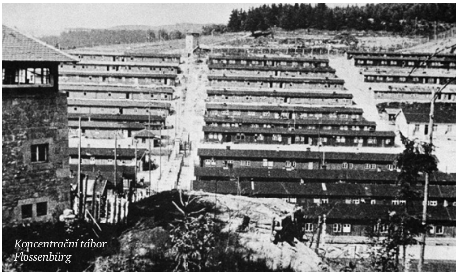
Koncentrační tábor Flossenbürg

vždy stopy svých zločinů zničit. Nedokáží to, ty zločiny byly příliš velké a krev zabitých volá příliš hlasitě. Je třeba ukázat, že nejde o cosi mrtvého, ale o příběhy konkrétních lidí, kteří skutečně žili a mají s námi společné i to, že nás každého může potkat tentýž osud. Koncentračním táborem Flossenbürg prošlo kolem statisíce lidí a zemřelo jich tam asi třicet tisíc. Byli tu Poláci, občané Sovětského svazu, Maďarska,