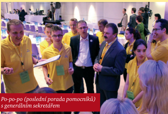
Po-po-po (poslední porada pomocníků) s generálním sekretářem