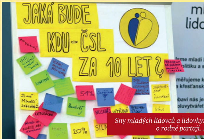
Sny mladých lidovců a lidovkyň o rodné partaji...